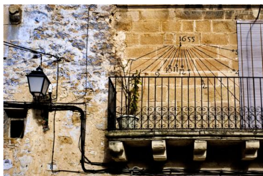
El Reloj de la Plaza - Miguel Sánchez Reina - Premio Especial Relojes de sol 2016.