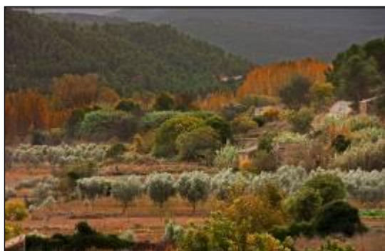
Camino a Valderrobres - Beatriz Pasamar Vidal - Foto ganadora Categoría Entorno y paisaje 2016.