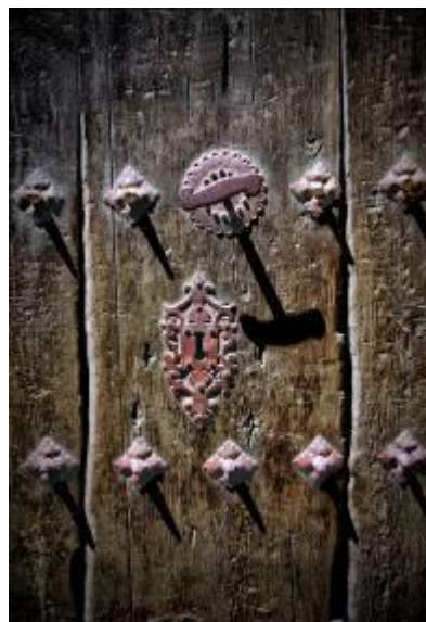
Puerta - Pere Soler Rius - Foto ganadora Categoría Arquitectura popular 2016.