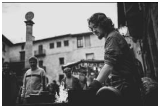
El herrero. Feria Medieval. Cretas - Marta Monreal Chasco - Foto ganadora Categoría Oficios y actividades tradicionales y fiestas populares 2016.